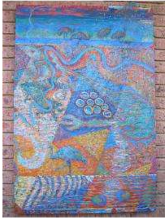
"Emu" par Geoff Buchan

L'évènement interactif de Plexus International, entre l'Australie et le Sénégal, est une invitation à commencer à dessiner une carte globale de l'érosion, dans une vision total, pour les futures générations, et créer un modèle ouvert de culture, pour des échanges sans fins.